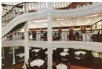
ダイニング (完成予想図)

フライング・クリッパーがスター・クリッパーズのフリートに加わると、現在、世界最大の5本マストの横帆艦装帆船としてギネスブックに登録されているロイヤル・クリッパーに代わって、世界最大かつ史上最大の横帆艦装帆船となります。